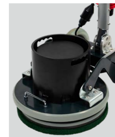
Optionales Zusatzgewicht, 12 kg. Art.-Nr. 207119