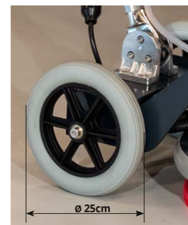
Hervorragende Treppengängigkeit und Stabilität.