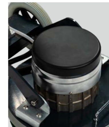
Motorschutzabdeckung schützt den Motor vor Feuchtigkeit.