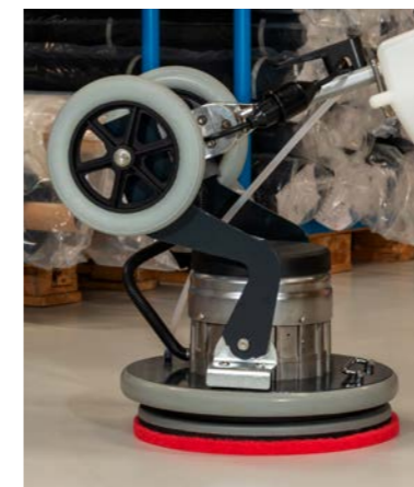
Kippbare Deichsel zur Erhöhung des Anpressdruckes.

Dank deutlich höherer mechanischer Reinigungswirkung